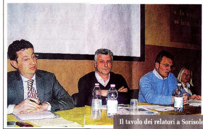
Il tavolo dei relatori a Sorisole

esprimeranno il loro "sì" o il loro "no" a quelle che sono, lo ripeto, solo ipotesi. Non è nostra intenzione forzare la mano alla cittadinanza. Voglio però ricordare che l'area del centro commerciale non è un terreno vergine, ma un'ex cava che ha avuto i suoi problemi di bonifica. Inoltre quell'area, con l'ipotesi di un nodo di interscambio modale (con la stazione della tramvia veloce oggetto di delibera provinciale e 24.000 metri quadri di parcheggio), permetterà di tenere all'esterno di Petosino il traffico viario. Ricordo altresì che lo studio dello Iulm sostiene